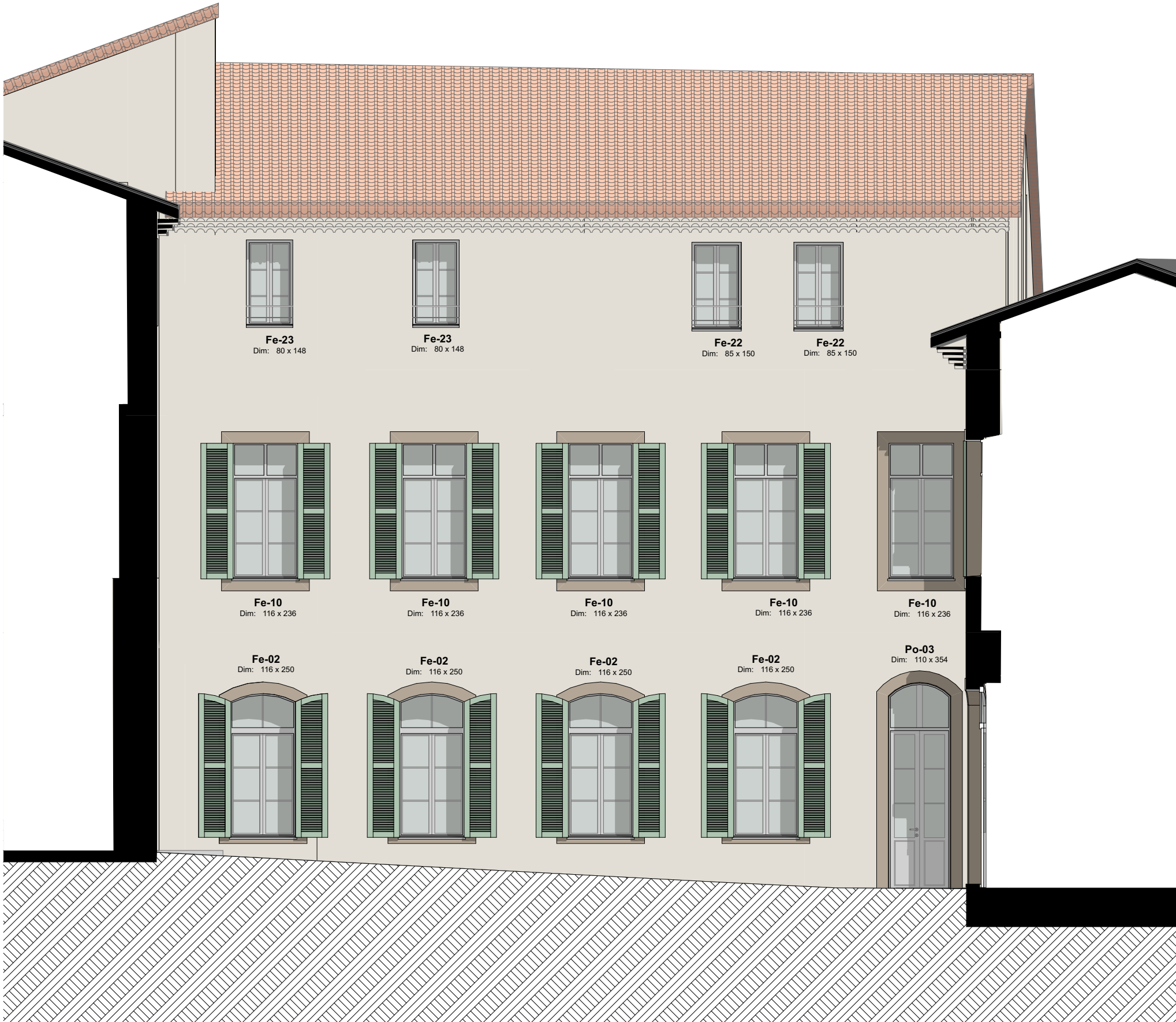
FAÇADE EST PROJET - CÔTÉ COUR - 1/75