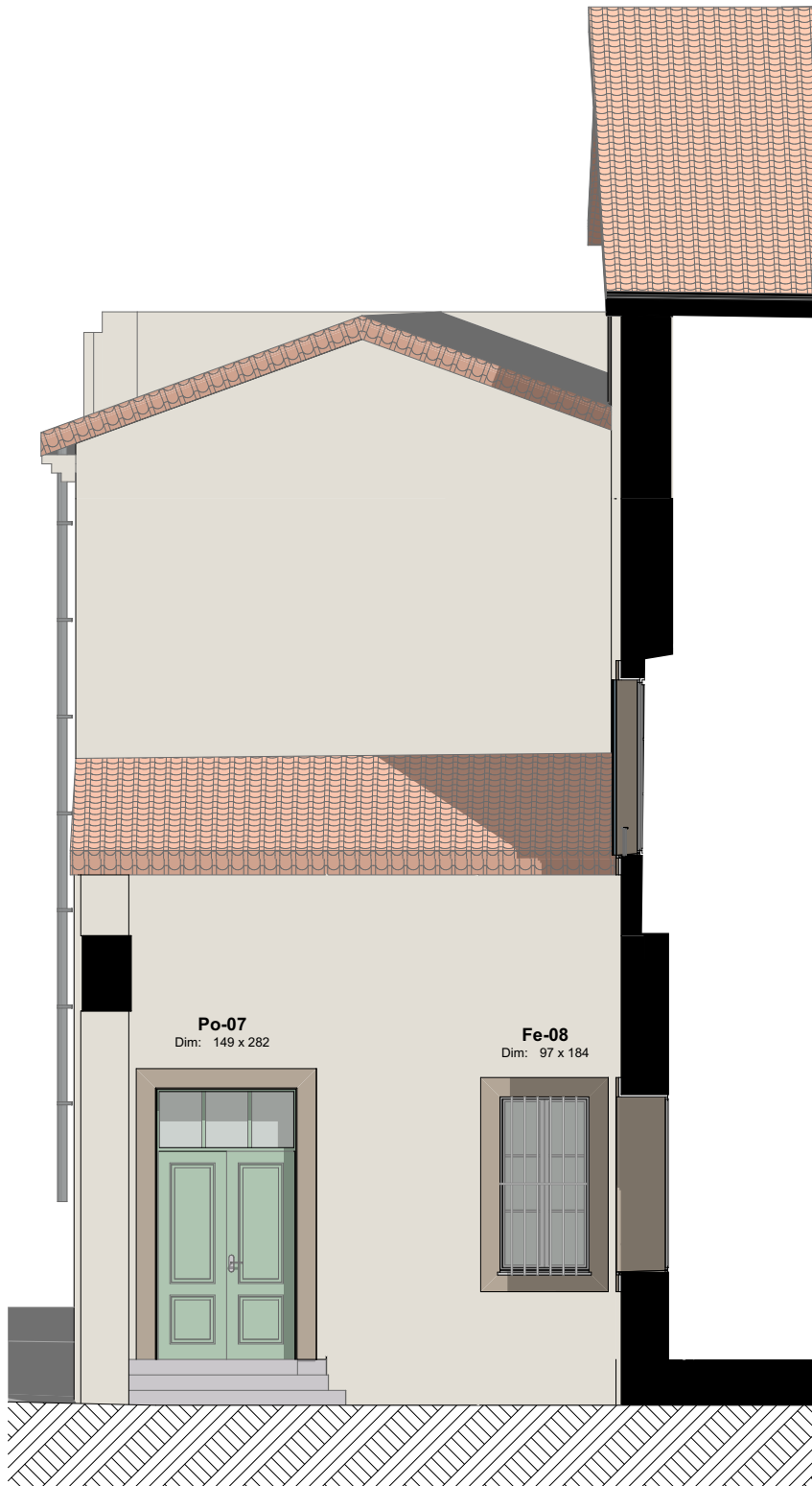
FAÇADE OUEST PROJET - COURETTE - 1/75